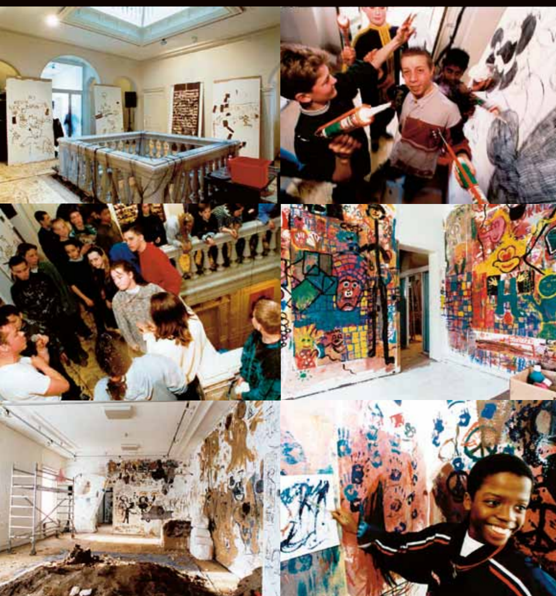
▲ Umbo (Otto Umbehr), Zonder titel, ca. 1927, gelatinezilverdruk, 34,8 x 26,4 cm, Bijzondere Collecties, Universiteitsbibliotheek Leiden © Pictoright Amsterdam ▼ Onze Vader, Ons Moeder, 1998, Museum Jan Cunen, Trias College, Oss

De tentoonstellingen van David Bade worden mede mogelijk gemaakt door: